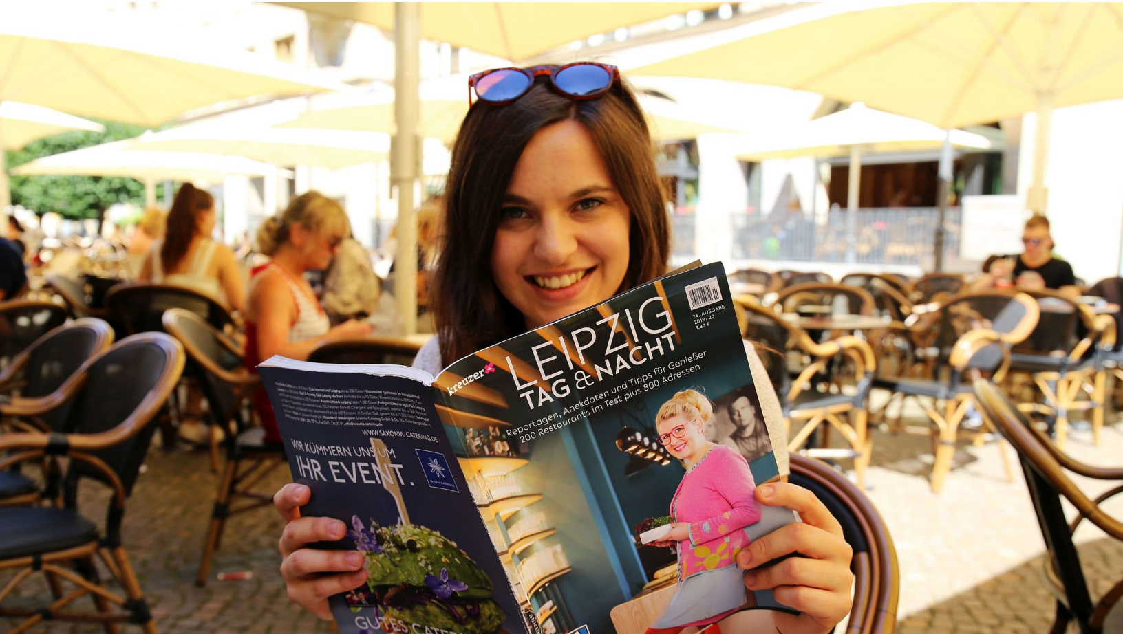
LEIPZIG Tag & Nacht - 200 Restaurants im Test