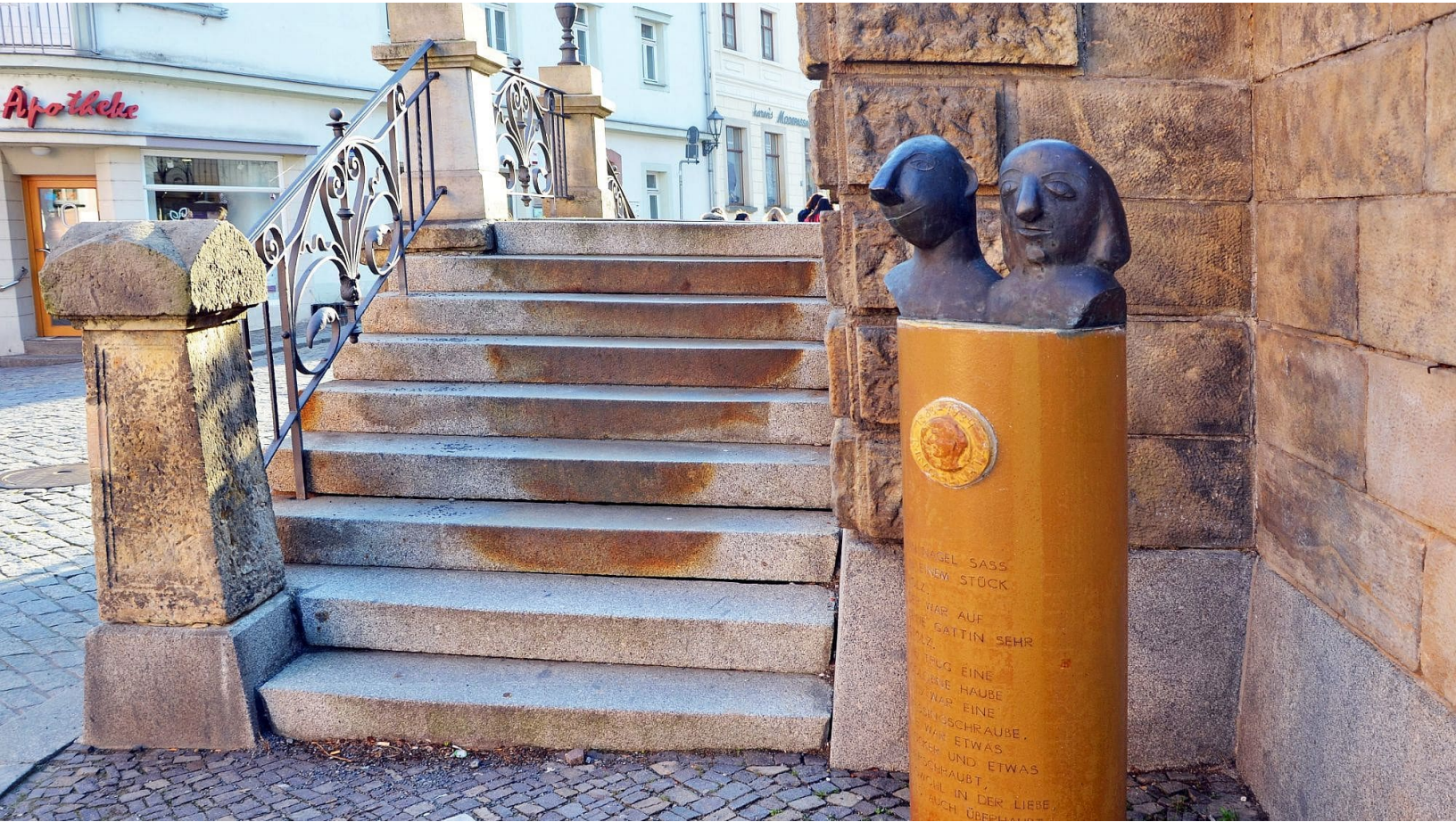
Eine der 13 Säulen auf dem Ringelnetzpfad in Wurzen