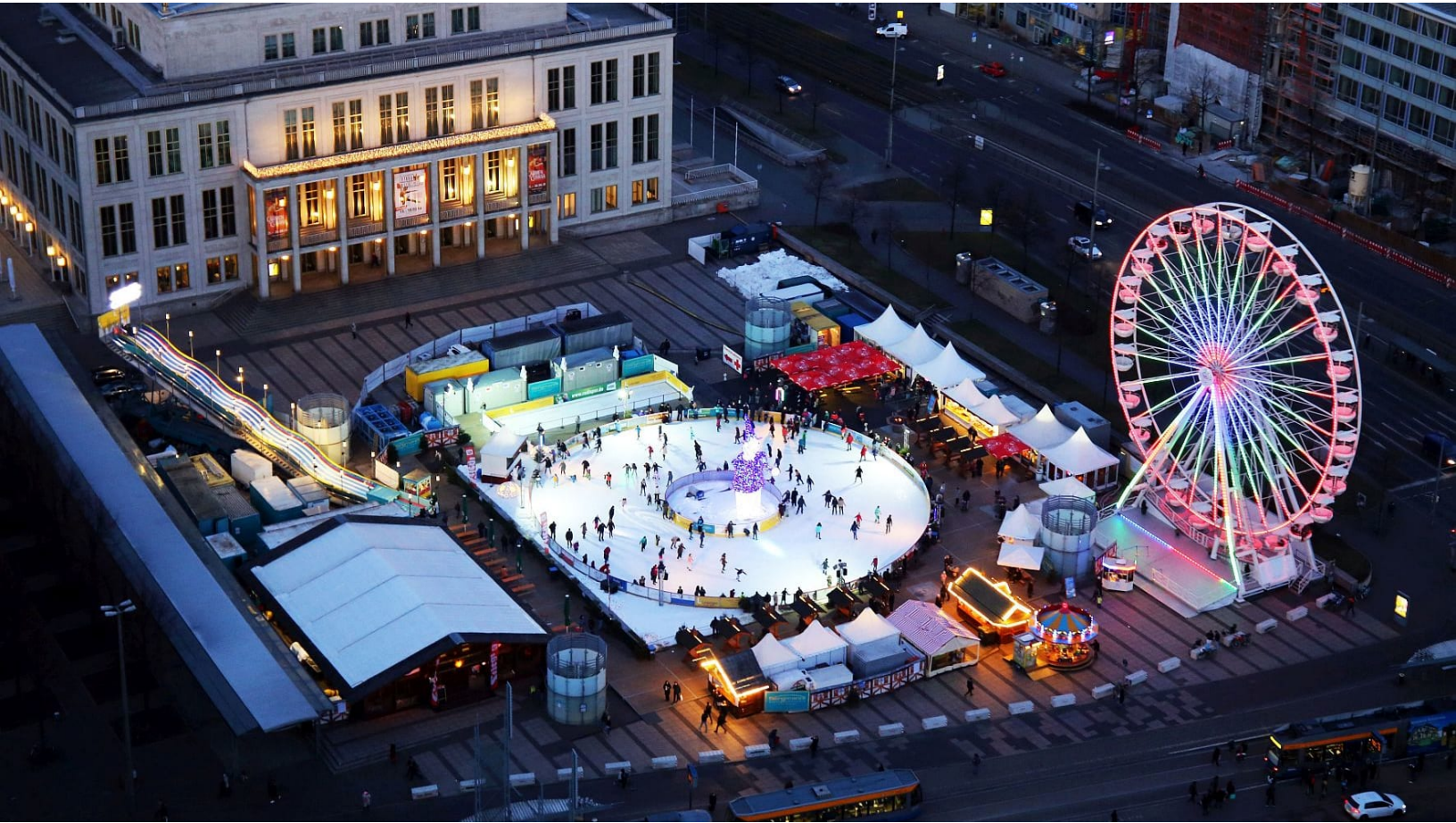
Leipziger Eistraum - Blick auf die größte runde Eisbahn Deutschlands