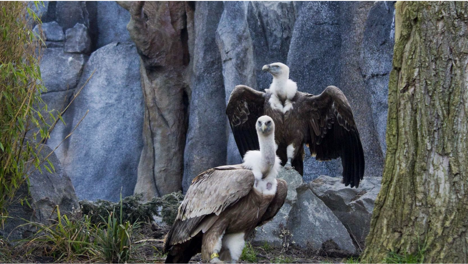
Gänsegeier in der neuen Freiflug-Voliere im Zoo Leipzig