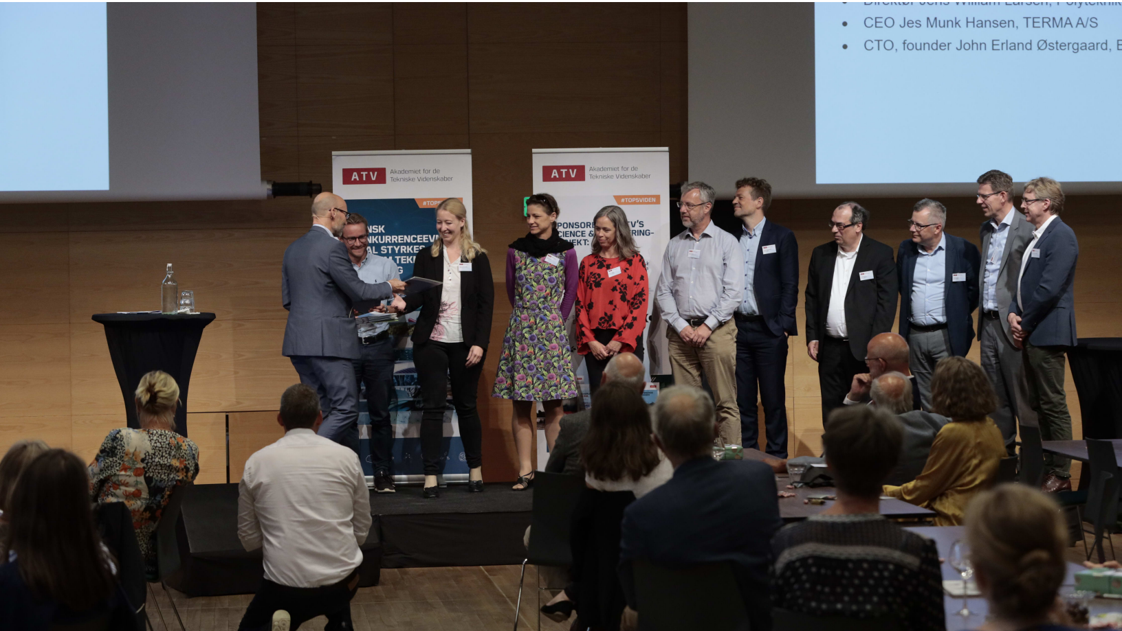
De nye medlemmer kom på scenen 10 ad gangen for at få overrakt et bevis på deres medlemsskab af Akademiet for de Tekniske Videnskaber.