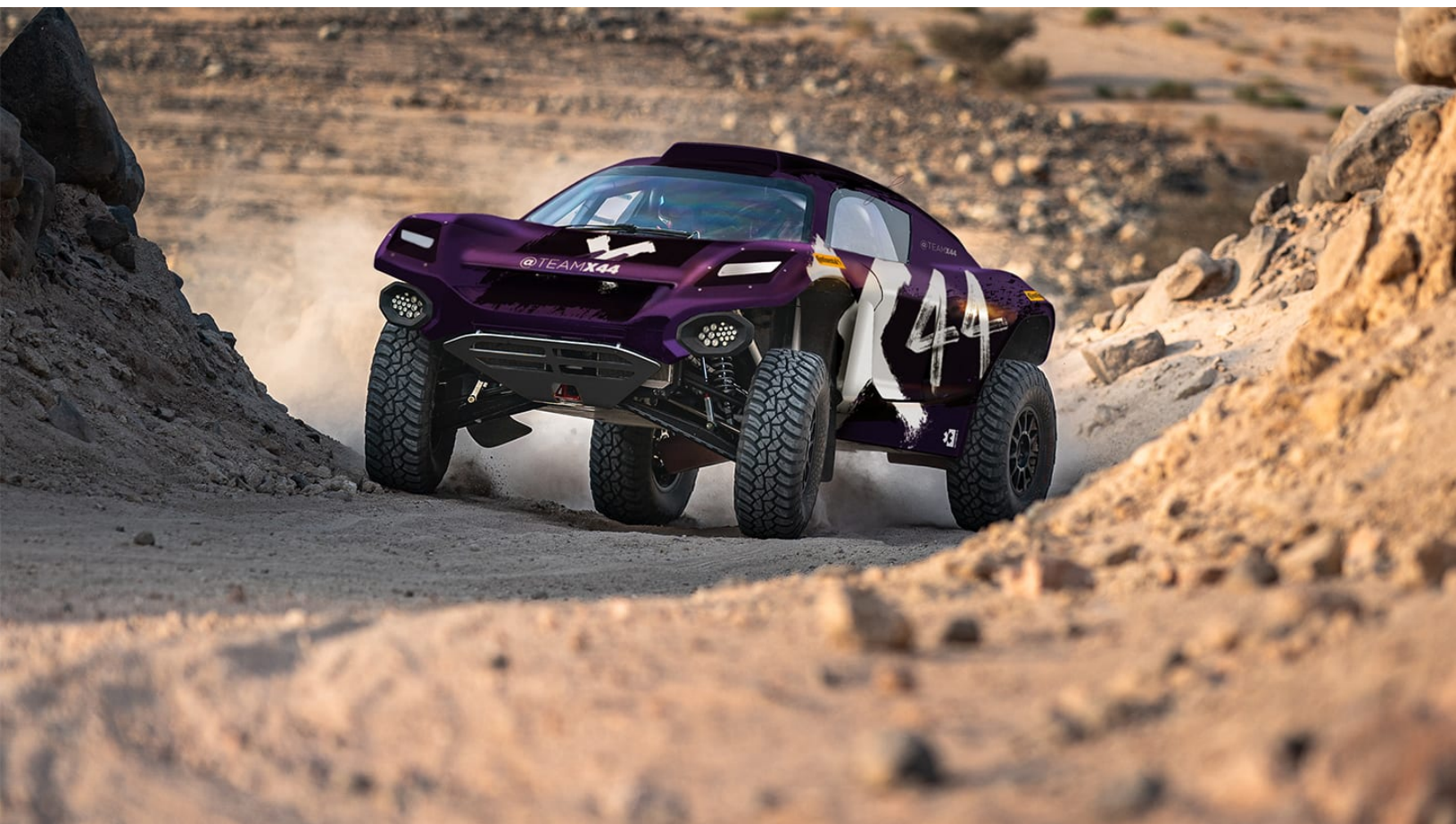
Hamilton's Team X44 will compete in the Extreme E with this car