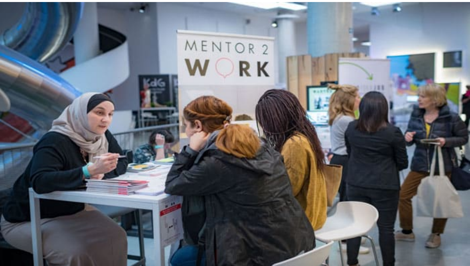
Het social-profiteersalon te Antwerpen