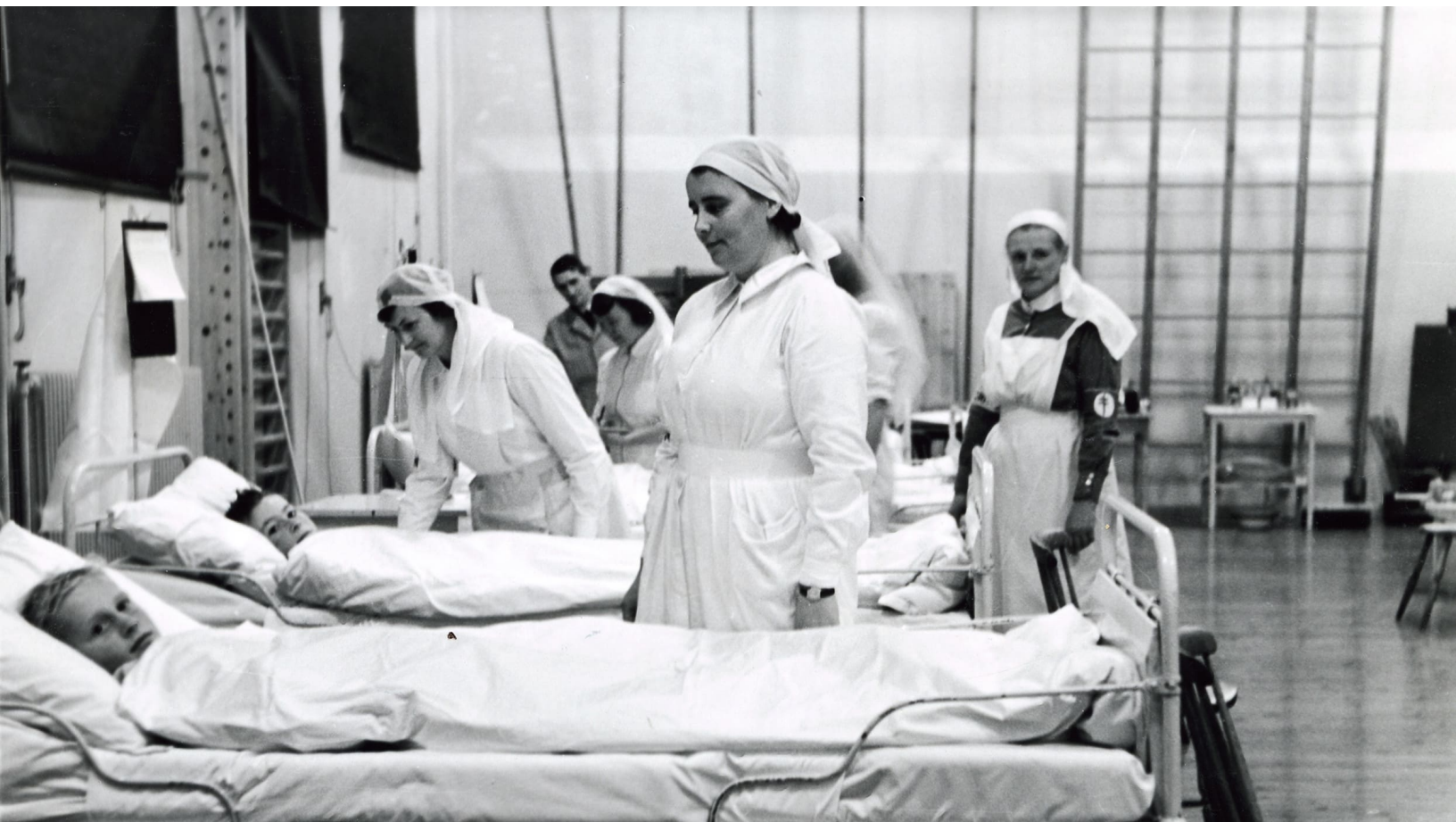
Fra blendings- og mannskapsøvelsene i Kristiansand Luftvernkrets 14.-15. oktober 1939.