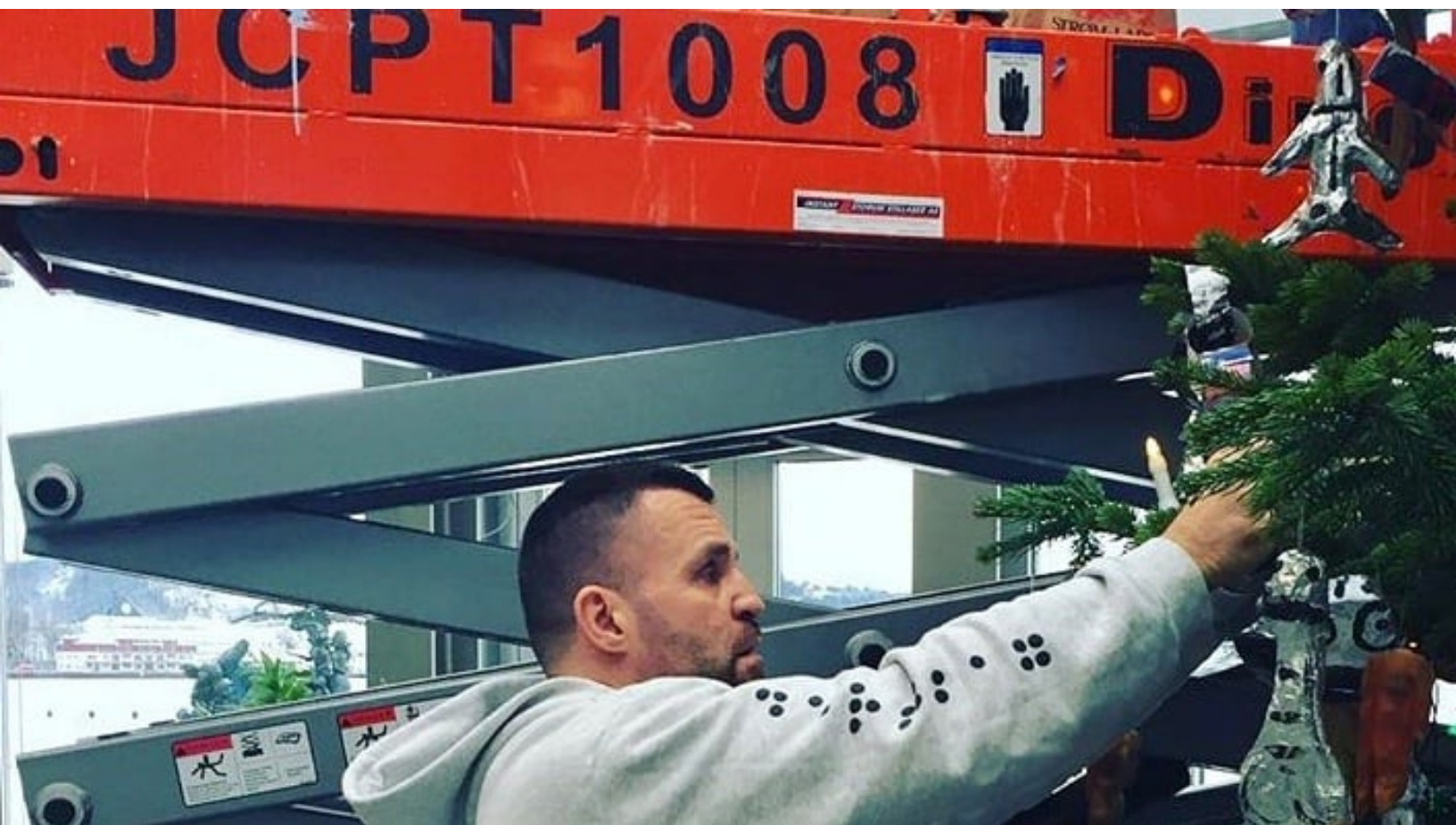
Bjarne Melgaard under pyntingen av årets Artist Tree