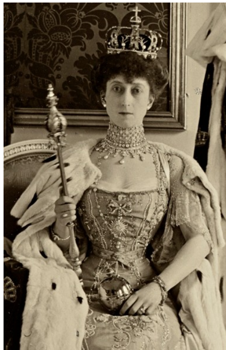
DRONNING: Maud var Norges Dronning fra 1905.

Polarskuta Maud var spesialbygget for et liv i isen og var et moderne, vitenskapelig forskningsfartøy. Da hun ble sjøsatt i 1917 var Roald Amundsens «Maud» det råeste skipet som kunne oppdrives, spesialbygget for Roald Amundsens ferd gjennom Nordøstpassasjen med mål om å drive over Polhavet og så nær Nordpolen som mulig. Hun tilbrakte flere år i isen, utstyrt med vitenskapelige apparater for å dokumentere en rekke forhold; meteorologiske, geofysiske og til å studere forhold i sjøvannet.