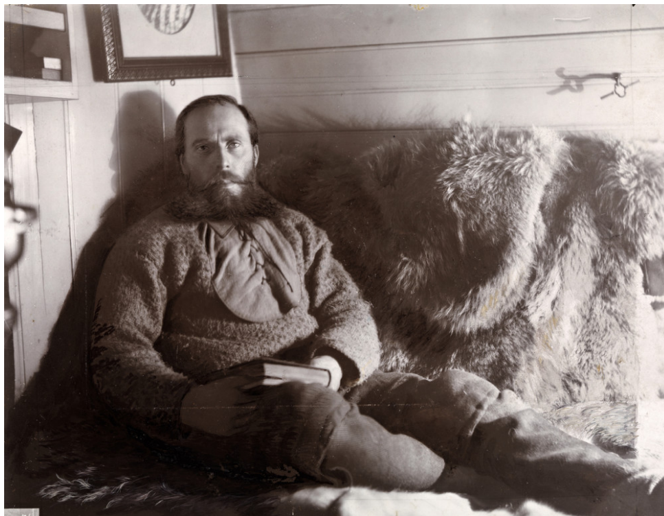
POLARHELT: Otto Sverdrup er en av våre største polarhelter. Her fotografert av Fridtjof Nansen.

Otto Neumann Knoph Sverdrup som er hans fulle navn, beskrives som en mann med enorm tyngde; sterk, traust og til å stole på. Dette var egenskaper som gjorde ham til Fridtjof Nansens betrodde høyre hånd. Etter Nansen-ekspedisjonen som krysset Grønland på ski, var Sverdrup senere sentral flere av ekspedisjonene som definerte Norge som polarstormakt.