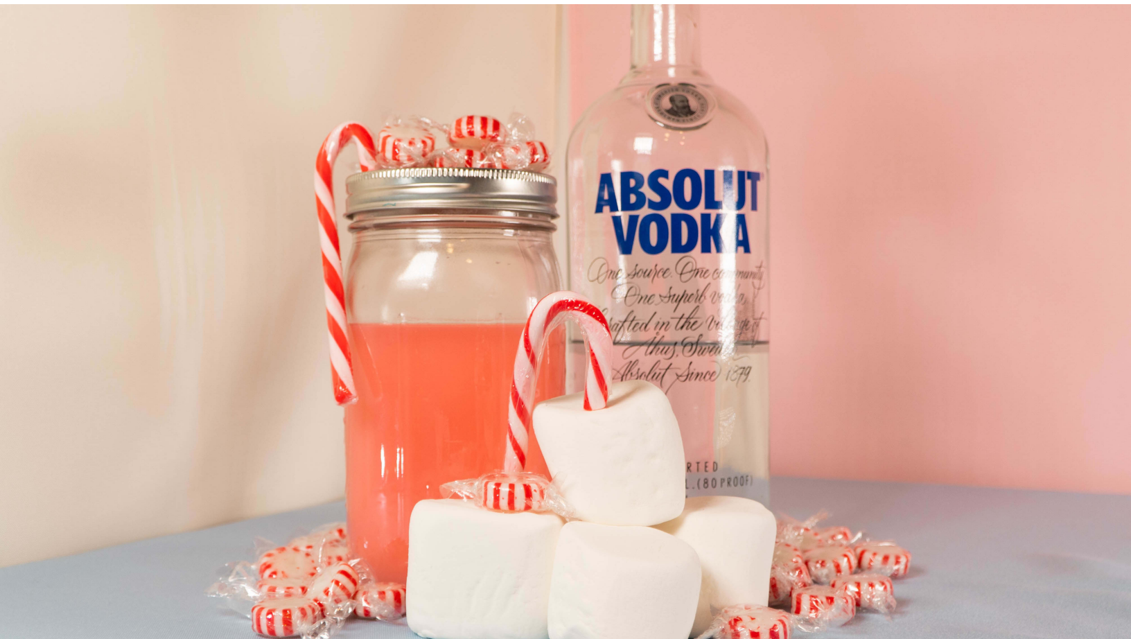
Absolut Toasted Marshmallow Peppermint Infusion