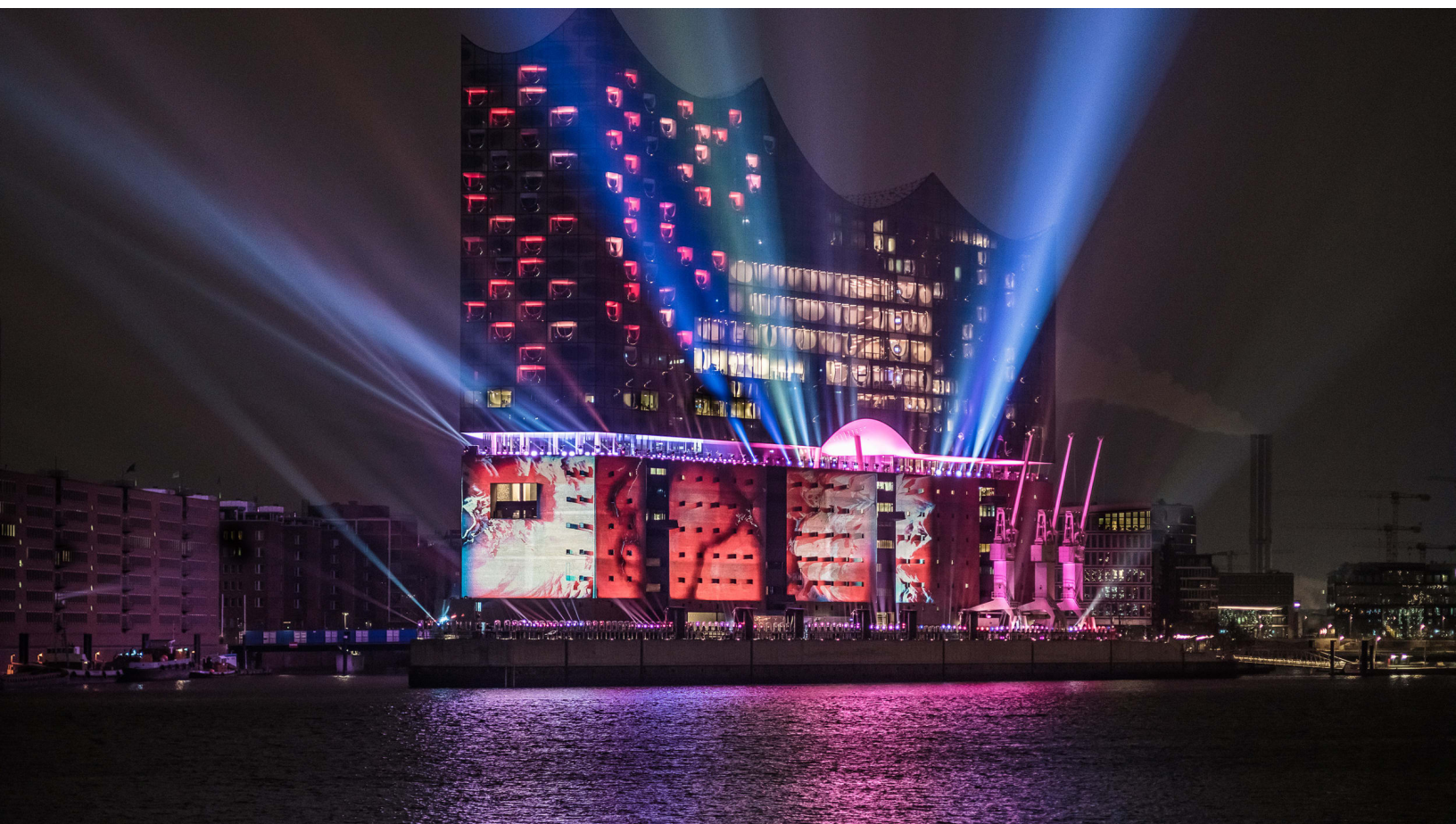
The spectacular light display on the facade of the Elbphilharmonie, Hamburg's new landmark