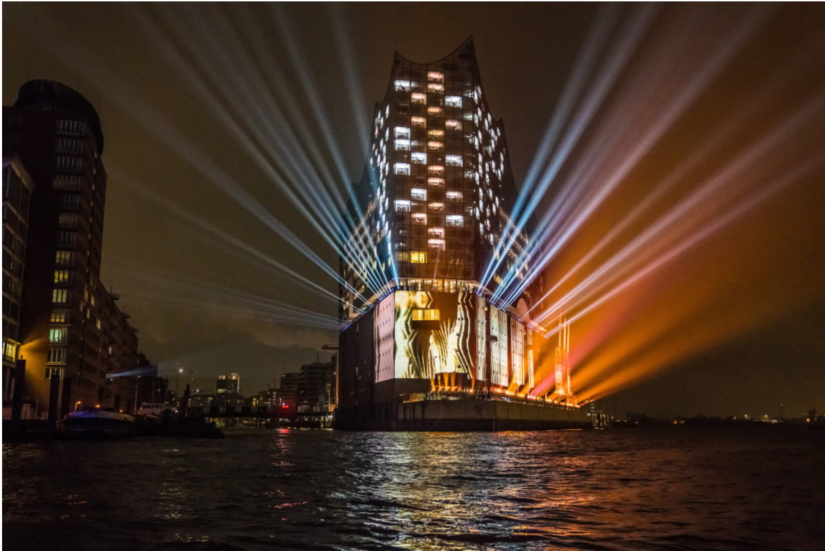
The spectacular light display on the facade of the Elbphilharmonie, Hamburg's new landmark"