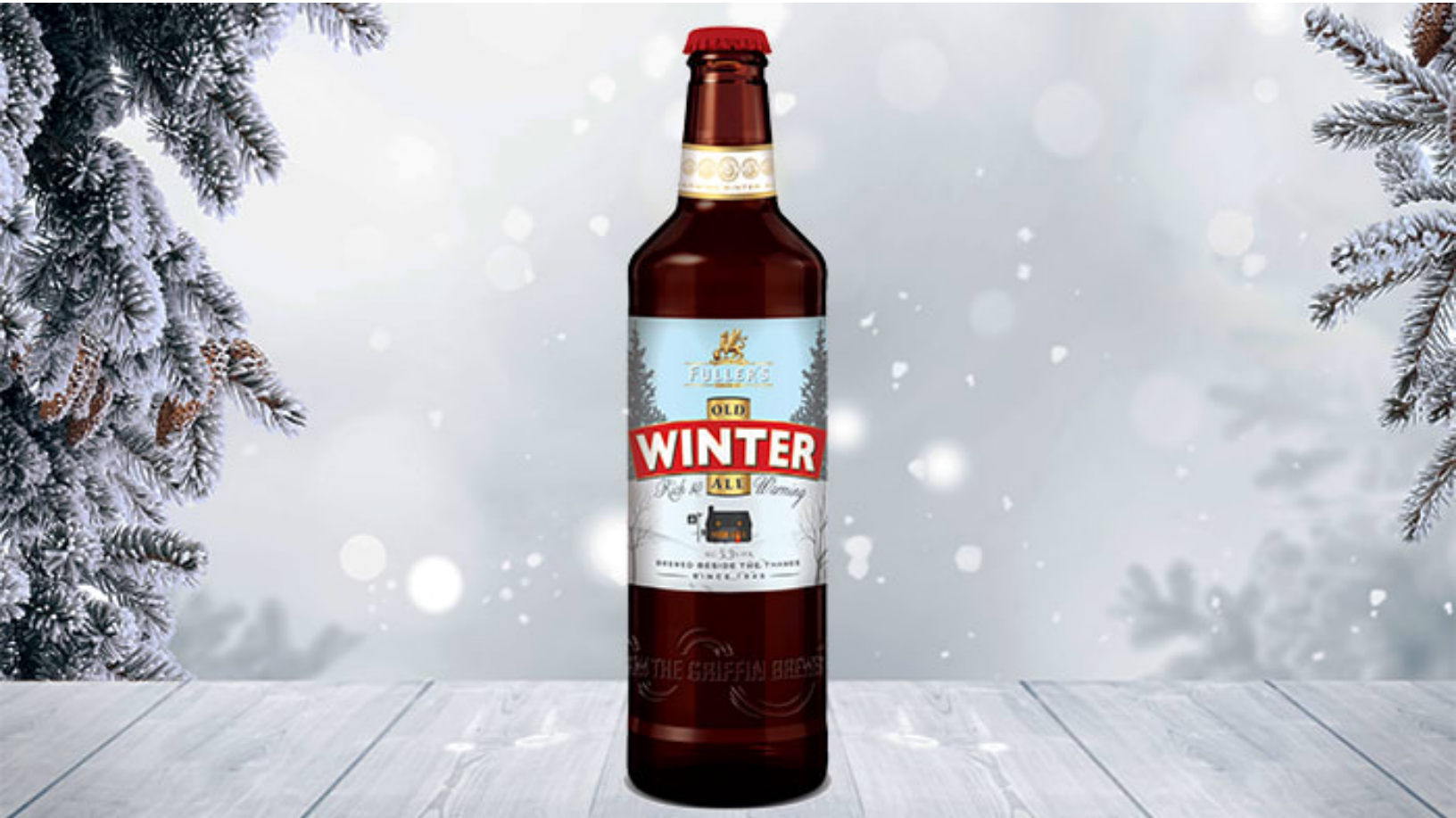
Fuller's Old Winter Ale - en klassisk vintervärmare