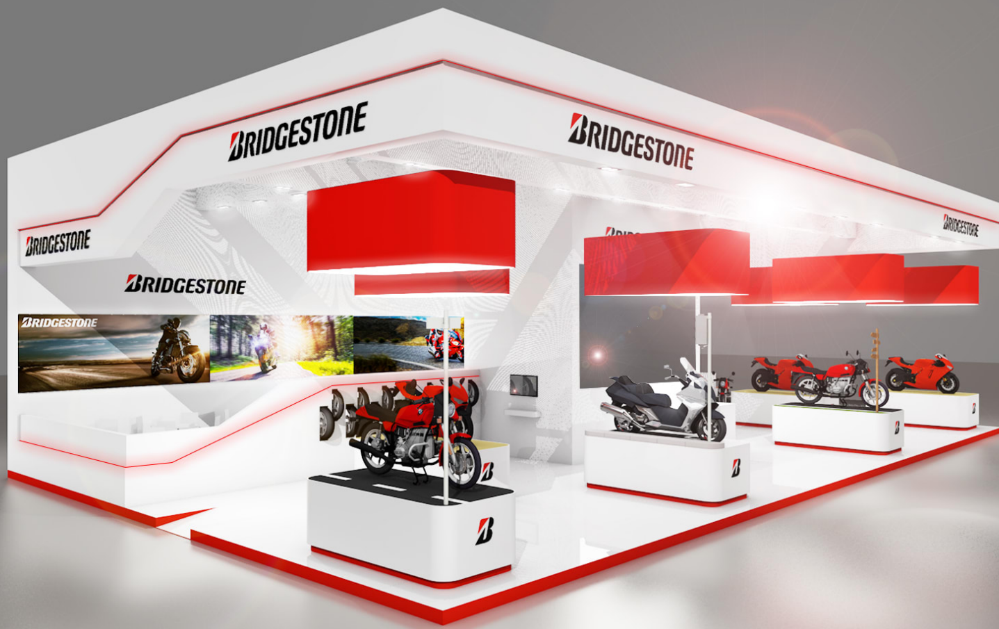
Bridgestone på INTERMOT 2018: hall 8, monter C020.