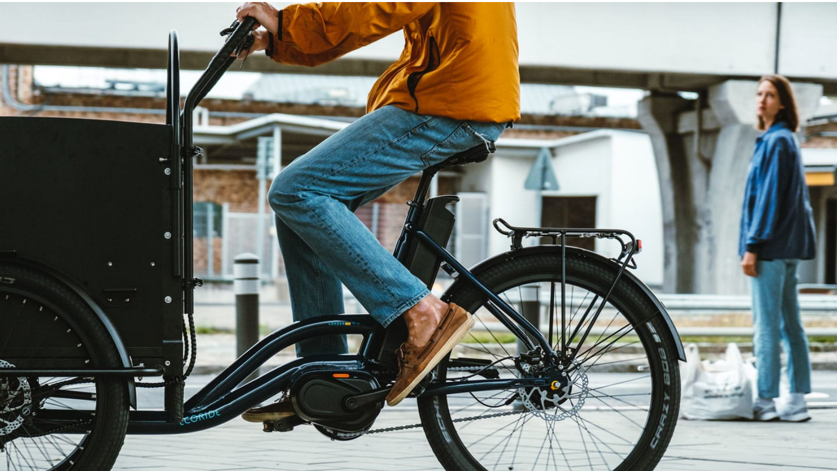
Lådcykeln "Loader" från svenska tillverkaren Ecoride