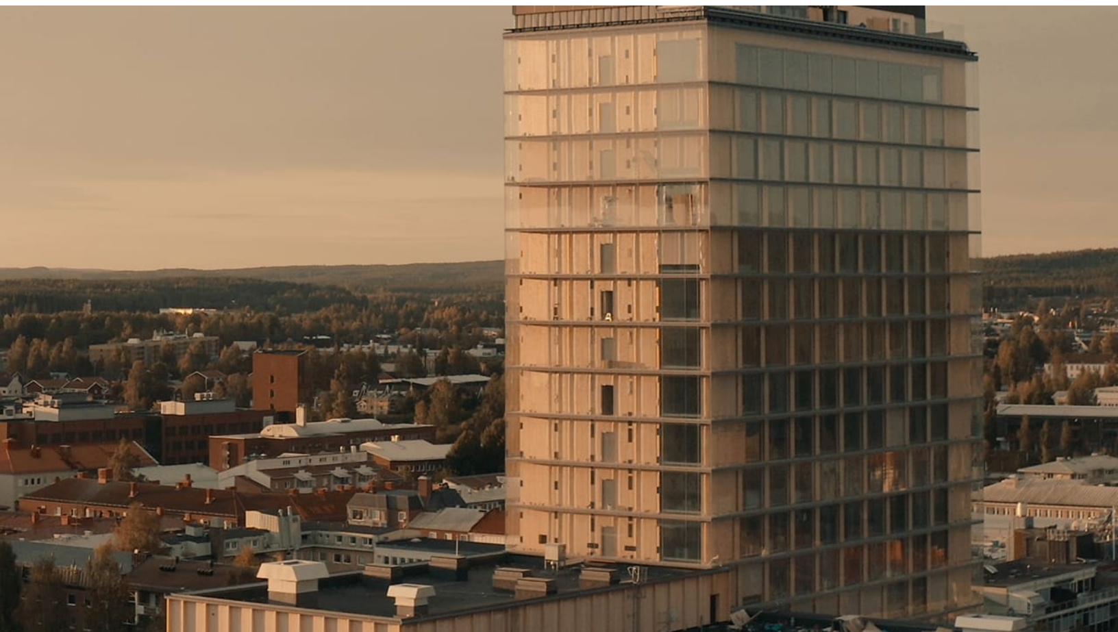
The Wood Hotel by Elite - en av världens högsta träbyggnader