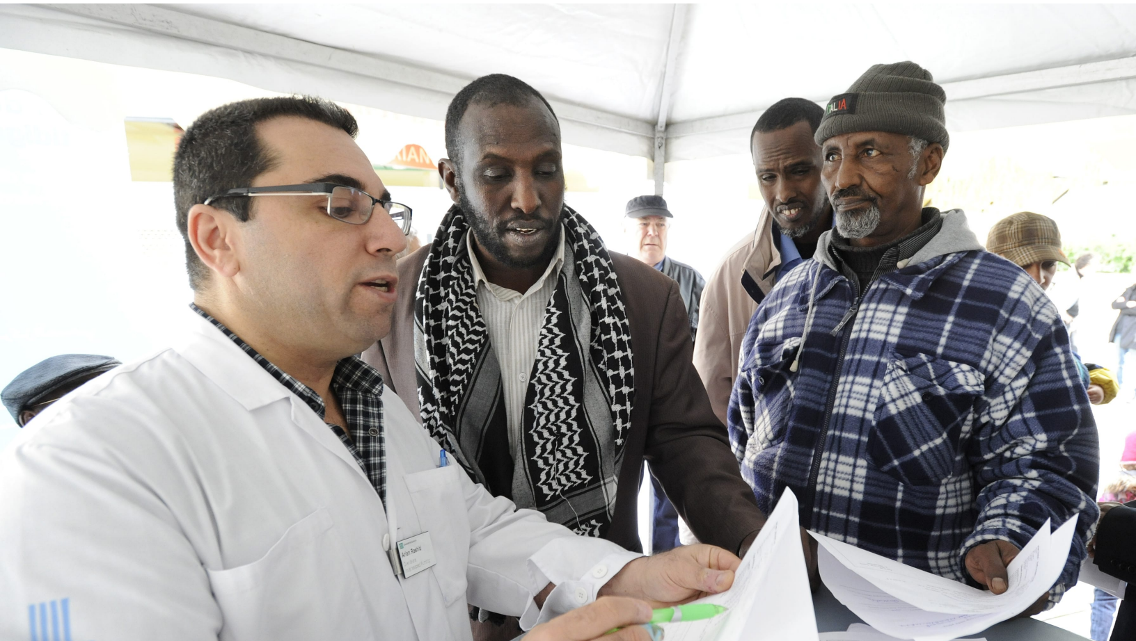
Lungfunktionstest i Rinkeby