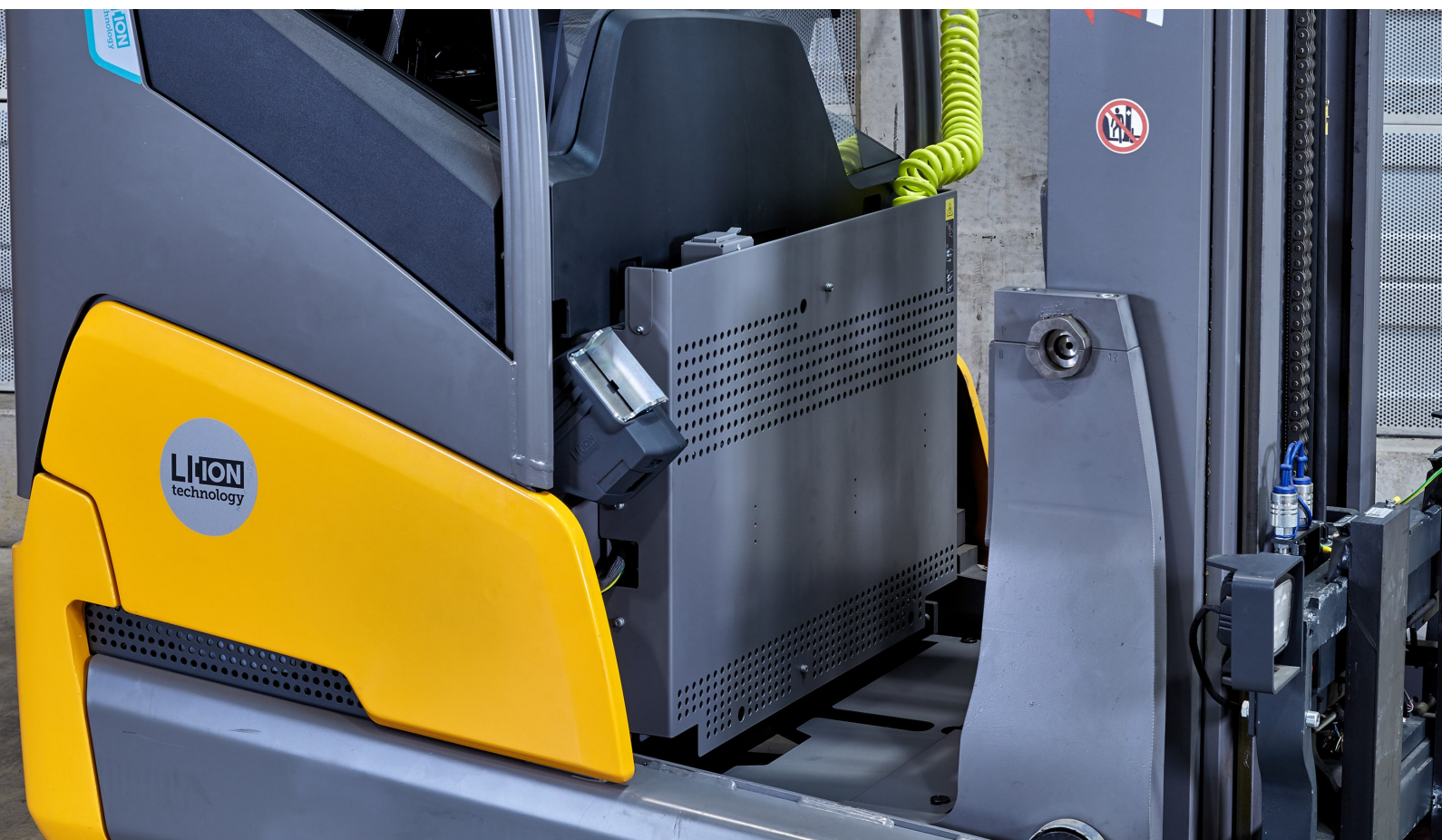
Inbyggd laddare för skjutstativtrucken ETV 216i