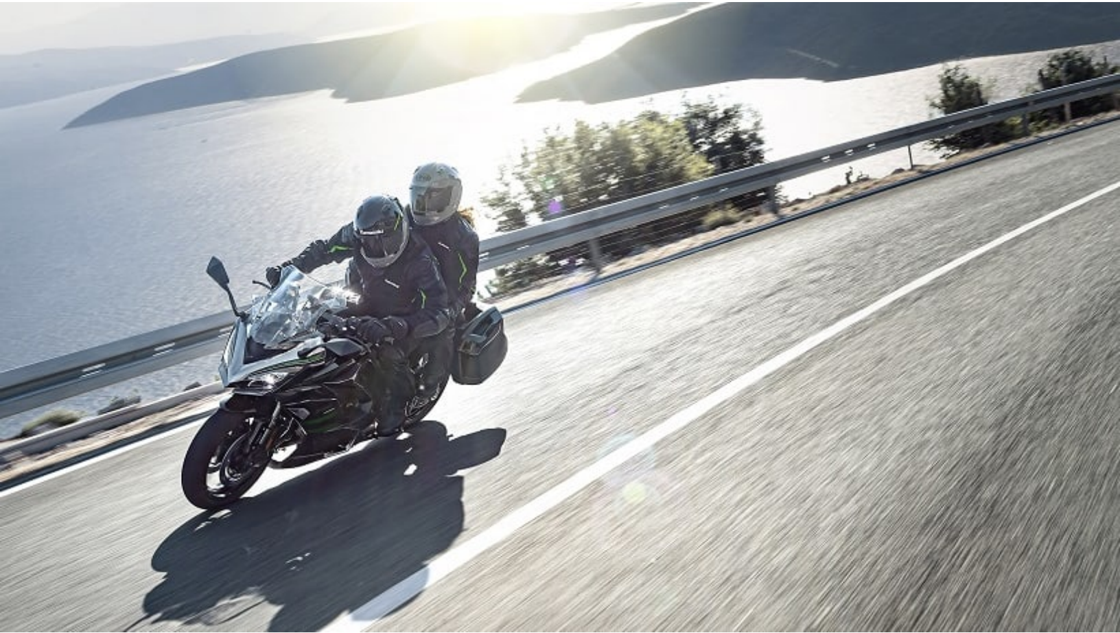
2020 Kawasaki Ninja 1000SX