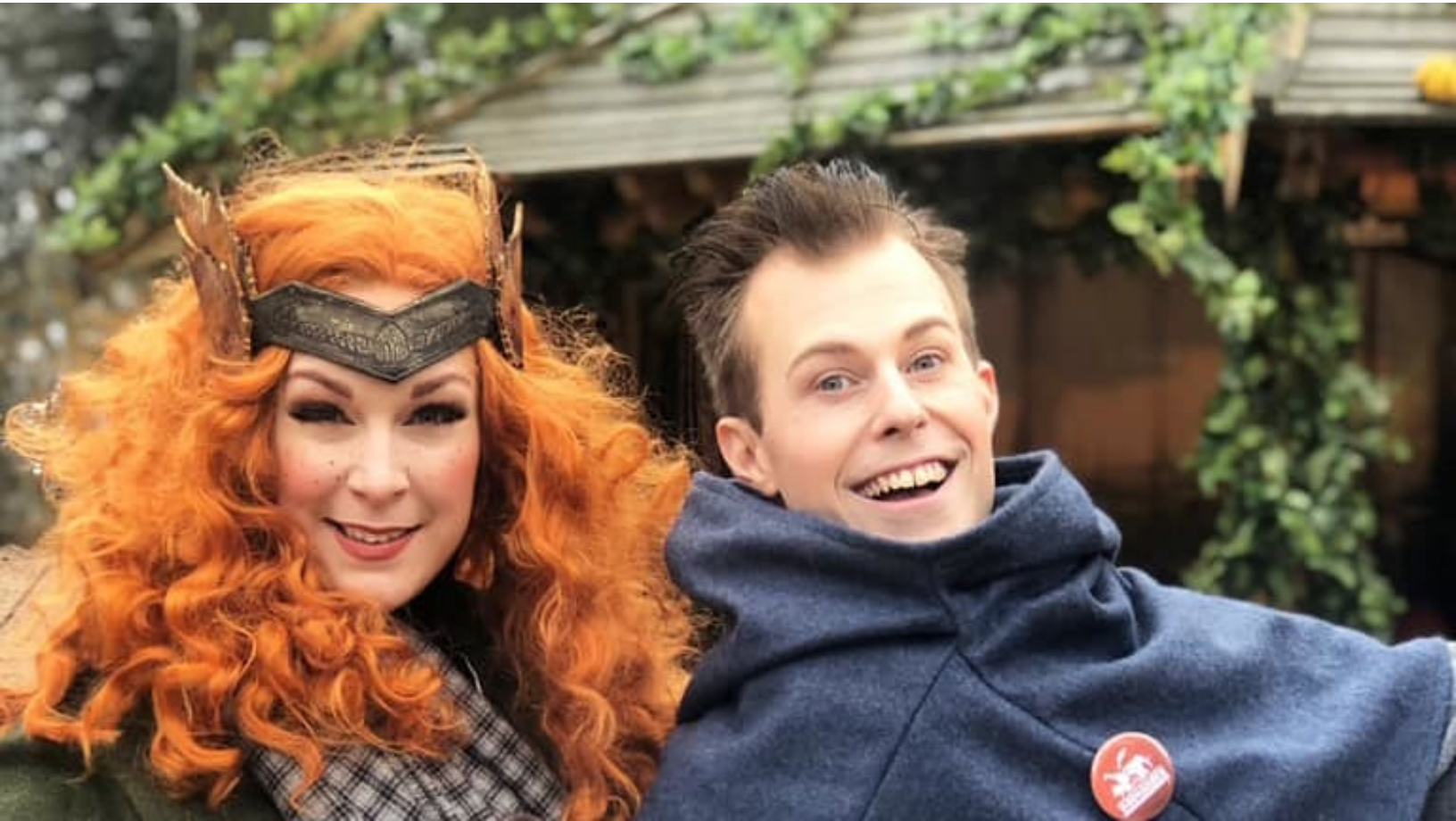
Halloween-väsen på Kolmården