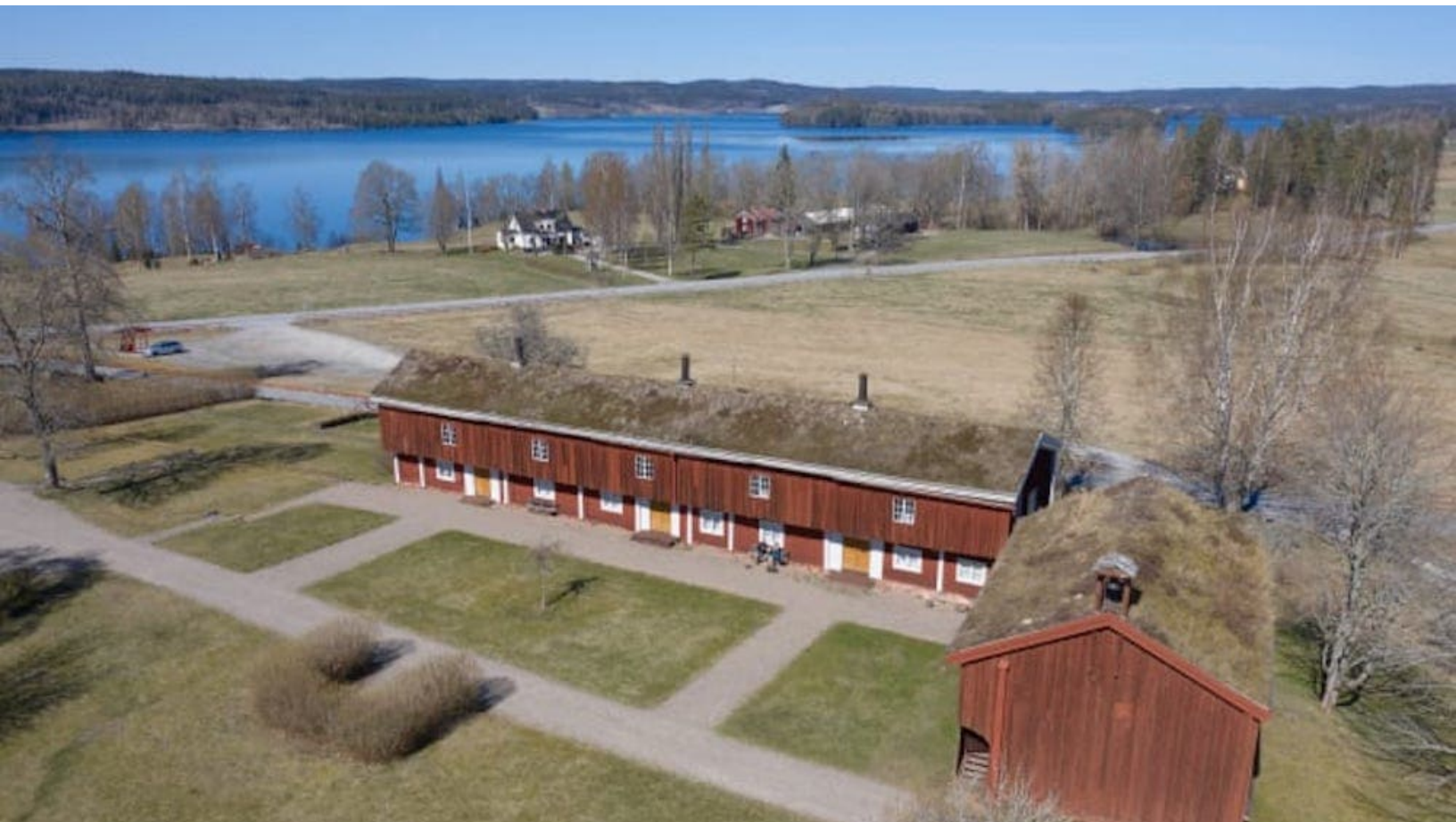
Siggebohyttans bergsmansgård.