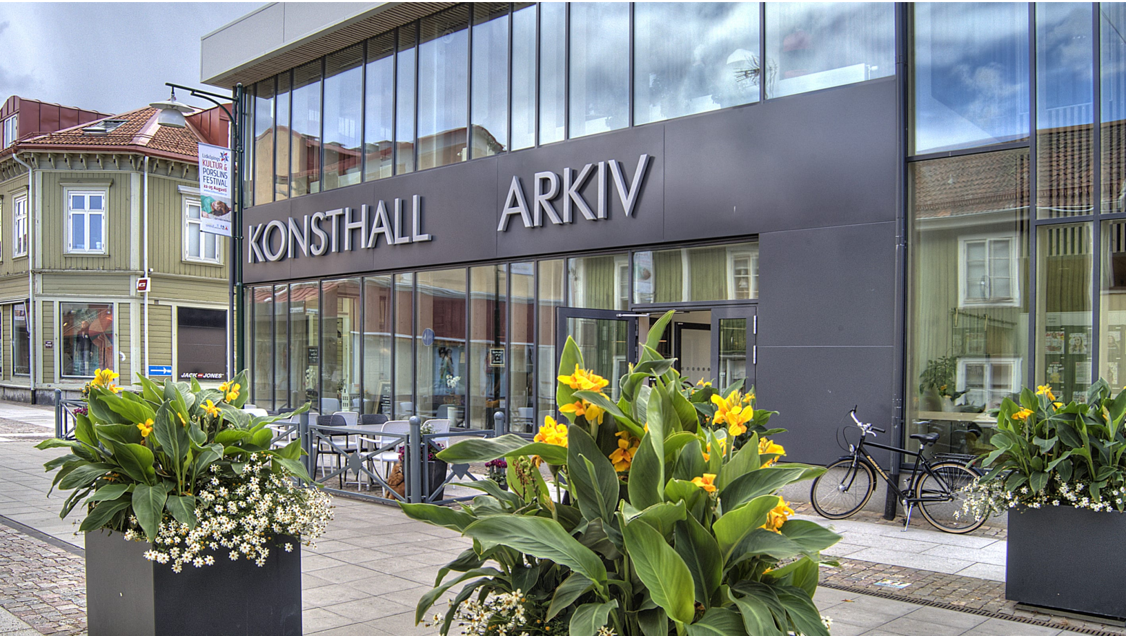
Bild på Konsthallen i Lidköping