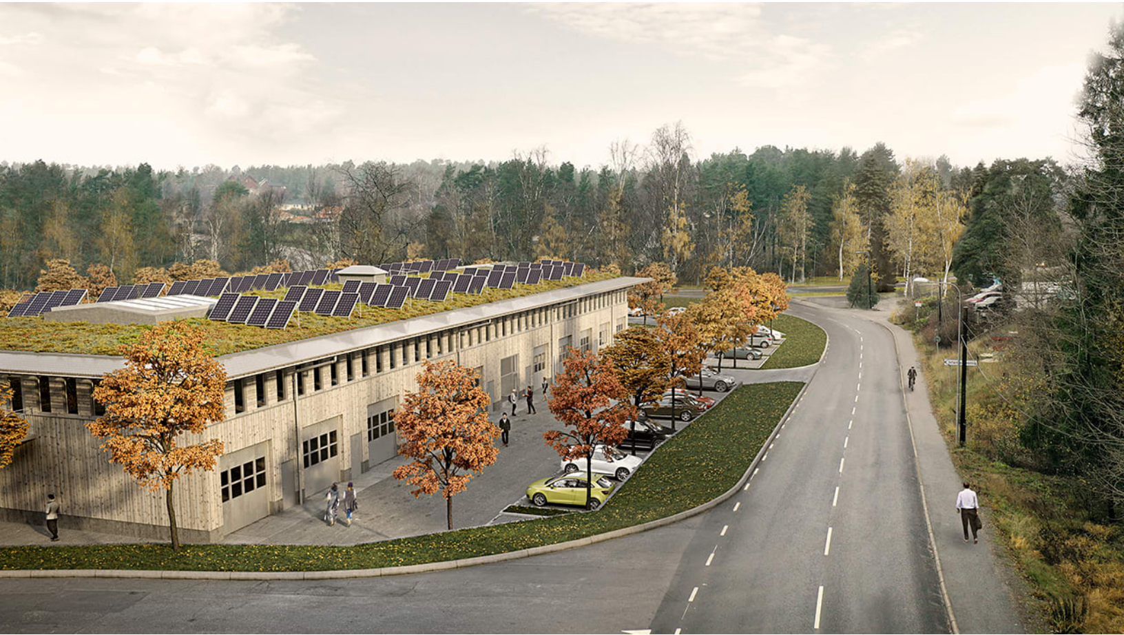
Kvarteret 1:80 i Saltsjö-Boo