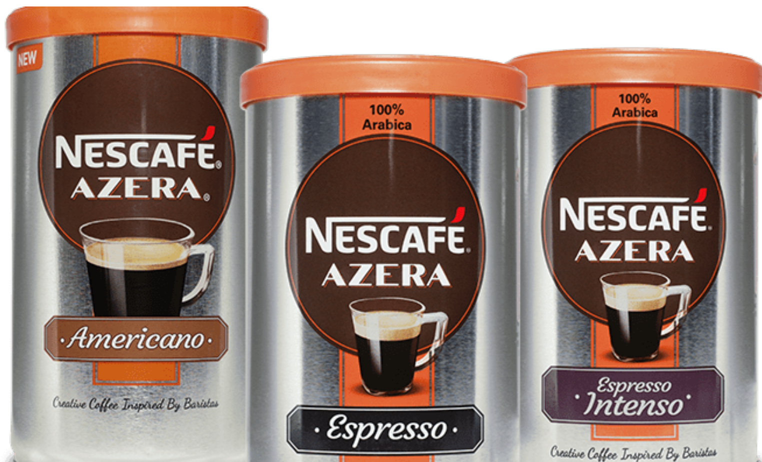
Snabbkaffe med cafékänsla