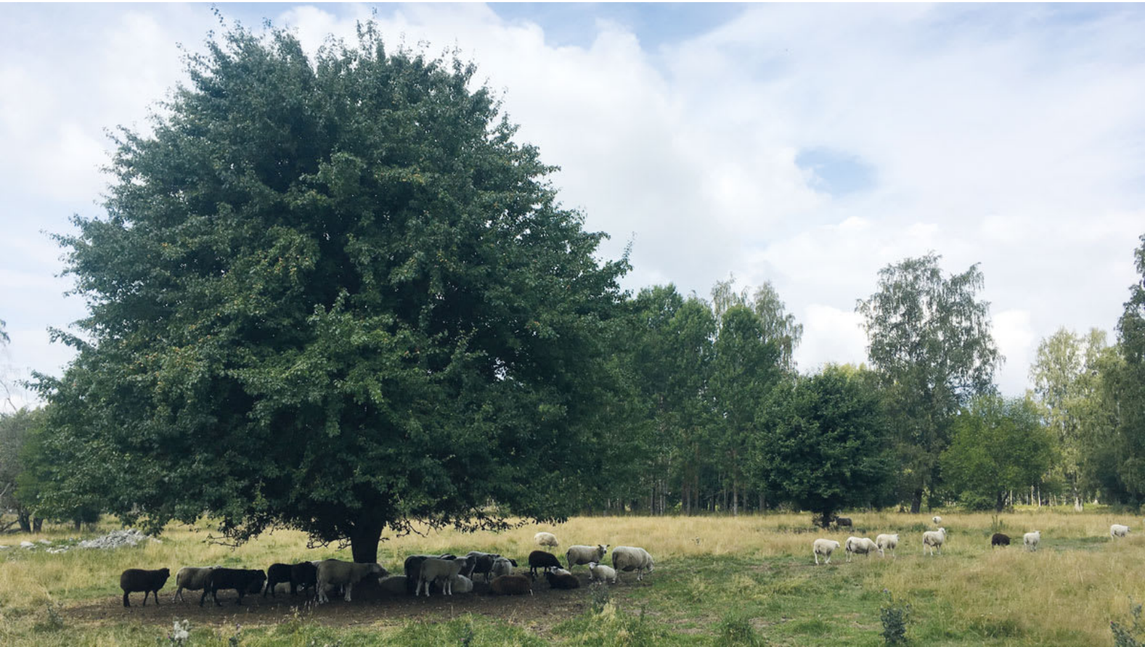
Betande får vid ängen på Björkön.