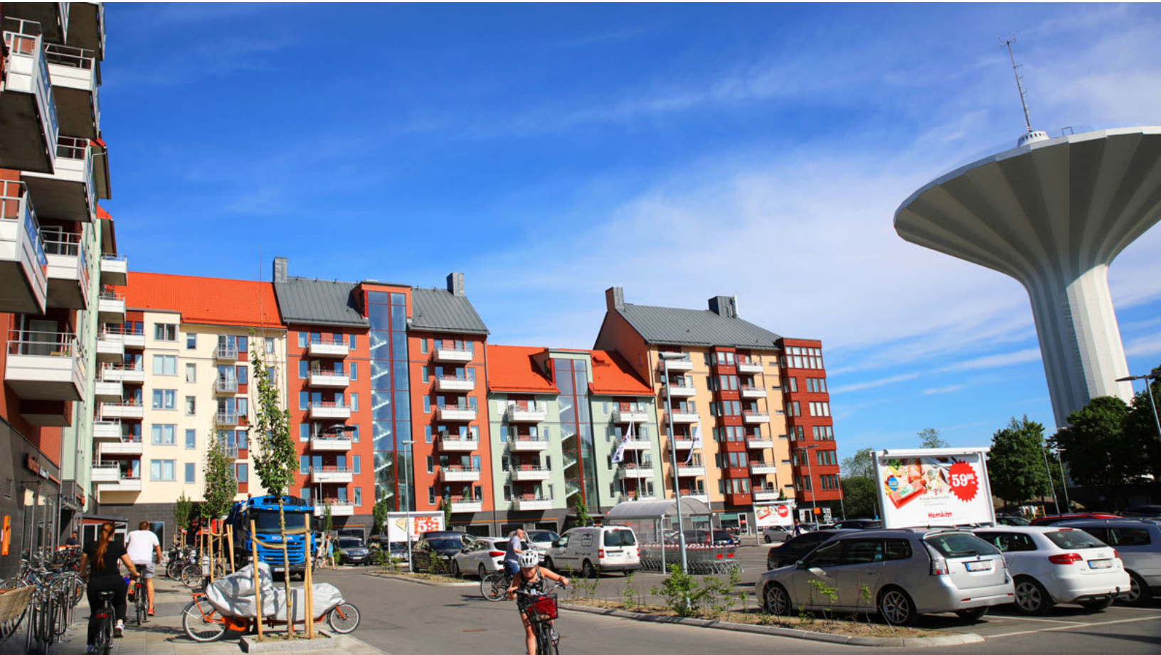
Mejeritorget i Örebro.