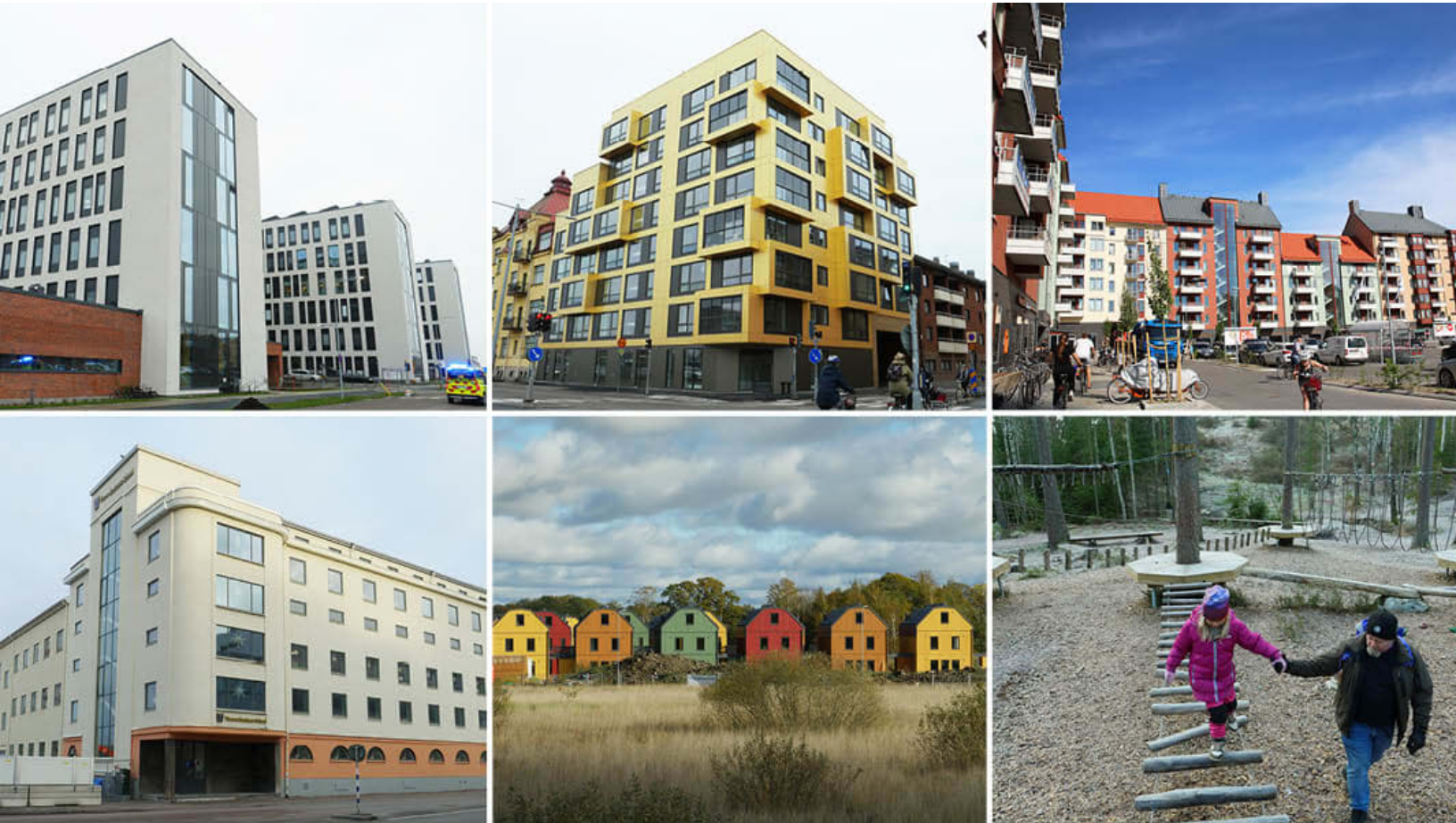
H-huset USÖ, Kvarteret Stenen, Mejeriområdet, Hakonhuset, Kvarteret Rördromen, Äventyrstigen.