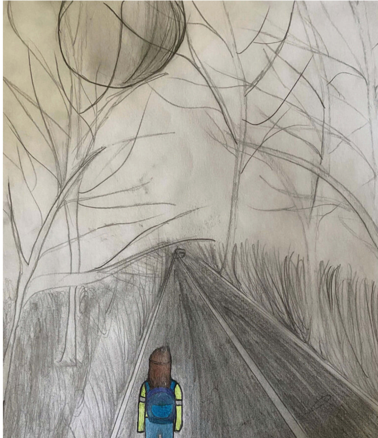
Vinnande bidrag i jubileumsdialogen "Min bild av Piteå"