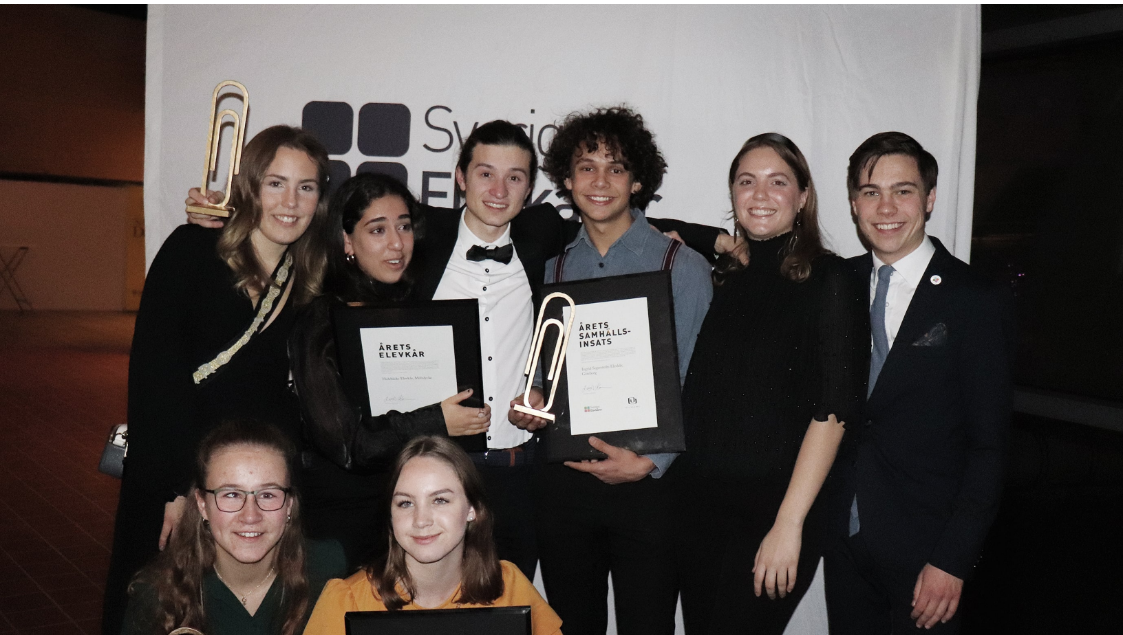
Årets vinnare av Guldgemet tillsammans med presidiet för Sveriges Elevkårers styrelse.