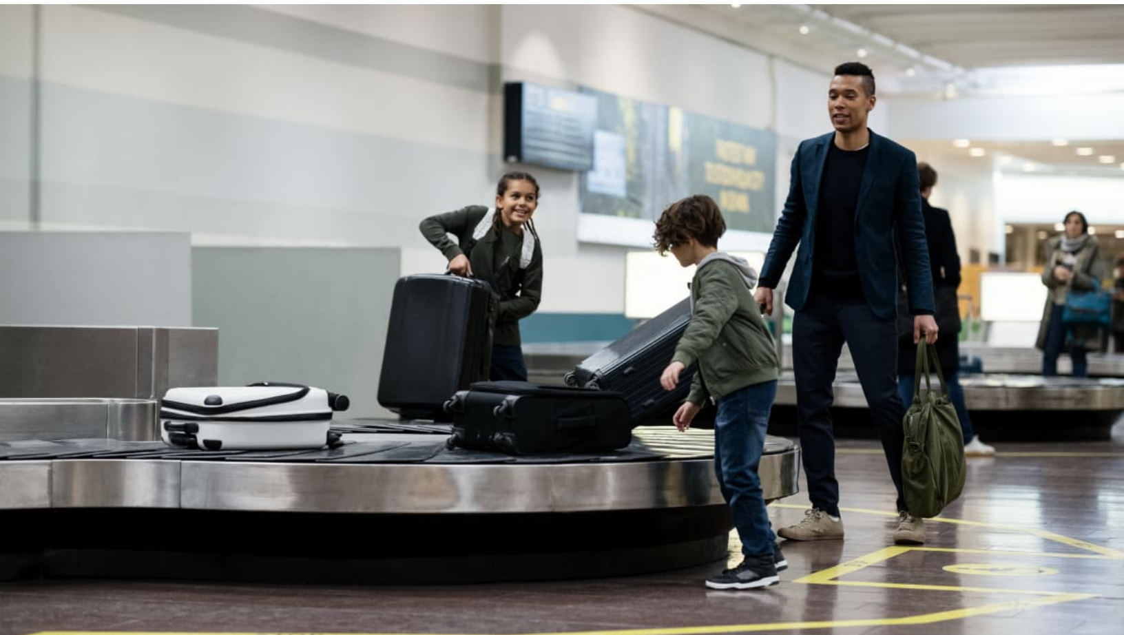
Stockholm Arlanda Airport.