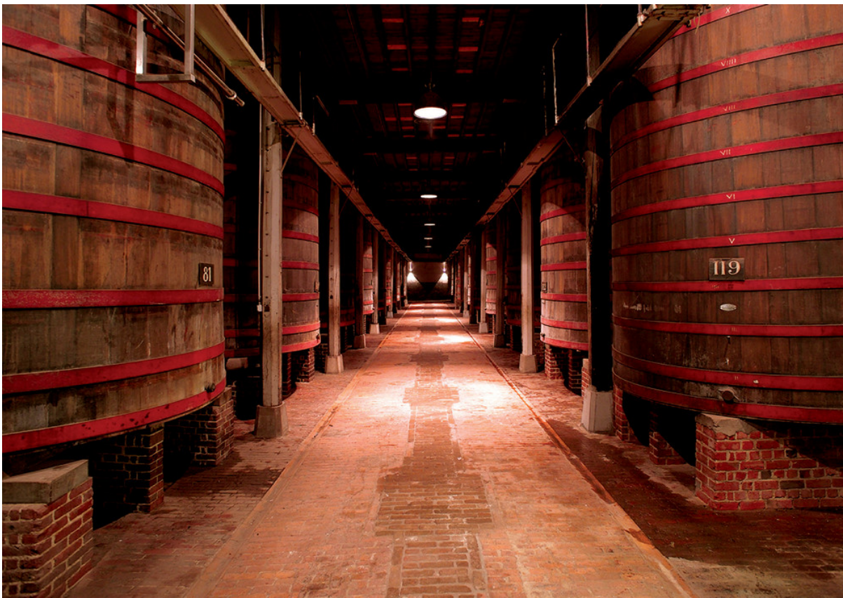
Rodenbachs uråldriga ekfat, vissa så gamla som 150 år.

Ölet består av 75% olagrad öl och 25% öl som lagrats på ekfat i 2 år, sedan tillsätter man färska körsbär och fläderbär. Rodenbach FruitAge är en av få fruktöl som innehåller 100% naturliga ingredienser