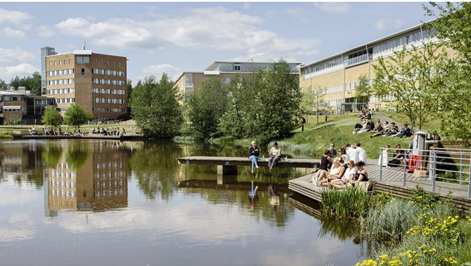
Många studenter söker sig till Umeå universitet.