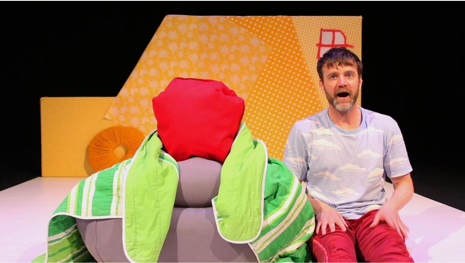
Föreställningen Mitt lilla stora rum