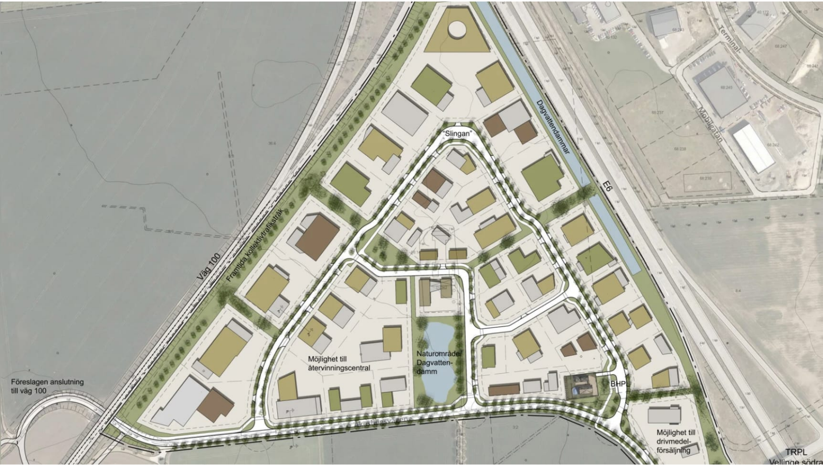
Illustration över det nya verksamhetsområdet