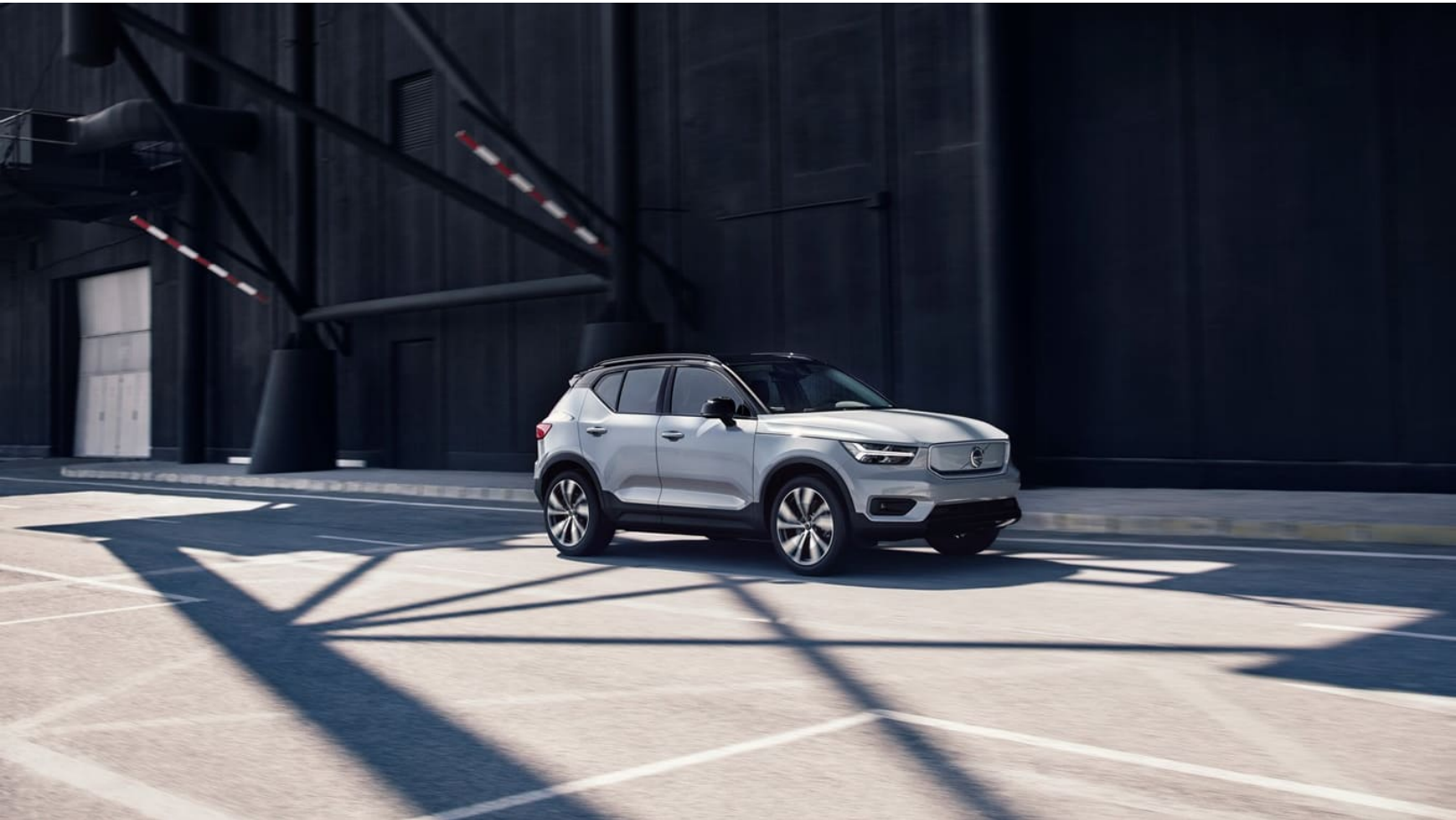
Volvo XC40 Recharge P8 AWD in Glacier Silver